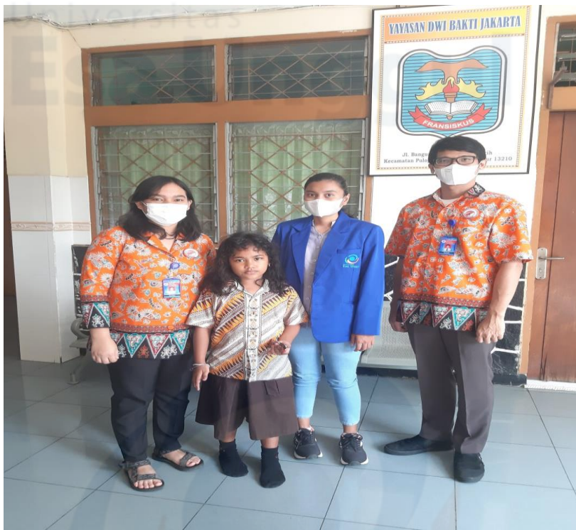
Gambar 54 Foto Bersama Guru Staff TU dan Siswa