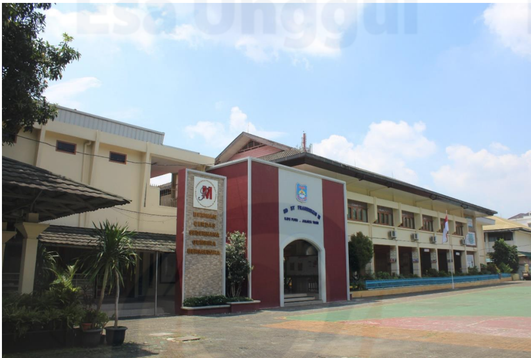
Gambar 53 Halaman Utama SD Santo Fransiskus III Jakarta Timur