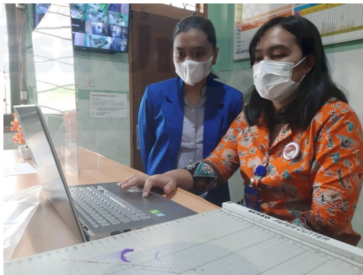
Gambar 56 Mempresentasikan Sistem Kepada Guru