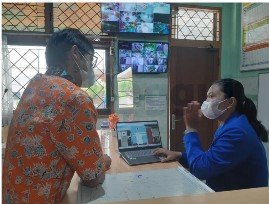
Gambar 55 Mempresentasikan Sistem Kepada Staff TU